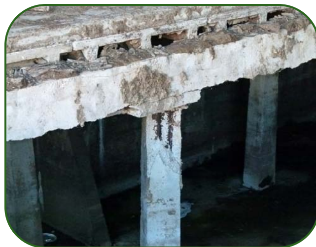
Figure 2. Détérioration des plaques, des poutres et des poteaux exposés aux gaz des fumiers

La partie inférieure des plaques peut être détériorée même si leur surface semble en bon état. En cas de signes de détérioration, une inspection doit être effectuée par un ingénieur. Pour ce faire, on doit procéder à partir de dessous et prendre des précautions