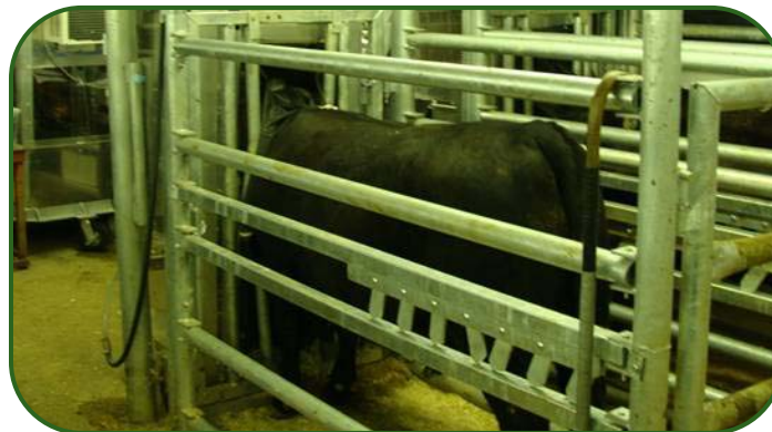
Figure 1. Bouvillons de parc d'engraissement dans des stalles individuelles pendant la mesure des gaz sur 24 h, centre de recherches sur les bovins de boucherie, Université de Guelph.

Au centre de recherches sur les bovins de boucherie d'Elora, de l'Université de Guelph, on se sert d'équipement de pointe pour évaluer les différences métaboliques chez des bovins dont on connaît l'indice de conversion alimentaire. Les stalles individuelles sont surmontées de dispositifs qui échantillonnent