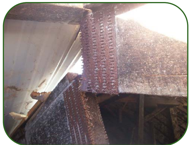
Figure 1. Détérioration des goussets métalliques avec l'humidité et le temps

Et les fermes? Certaines des membrures inférieures (éléments de structure horizontaux les plus près du sol) ont-elles été brisées par le chargeur lors du déplacement des balles? La cassure d'une seule membrure inférieure peut n'avoir encore que peu d'effet parce que les fermes voisines fonctionnent comme un tout. Cependant si deux fermes contiguës ou si les membrures inférieures de plusieurs fermes sont cassées, il faut les réparer, sans oublier les bris isolés. On prévient ainsi l'apparition de problèmes plus graves à l'avenir.