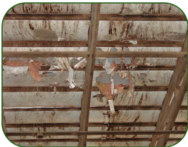
Figure 3. Les oiseaux et les rongeurs endommagent les isolants non protégés

Au cours du temps, les planchers peuvent devenir glissants sous l'effet de la friction lames de racleur ou des chargeuses frontales. On peut y remédier en taillant des sillons en forme de losange dans la surface ou en travaillant celle-ci.