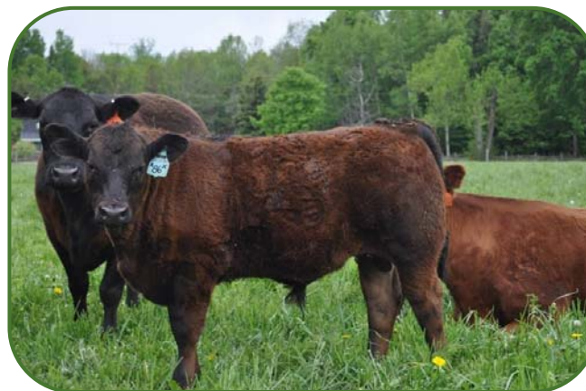
Fig. 1—Photo de bovins de boucherie noirs bien nourris au pâturage.

Le pâturage représente la source d'aliments la plus économique disponible et les possibilités d'améliorer la production sont nombreuses dans la plupart des fermes. Des éleveurs de bovins de boucherie ont rapporté des gains de pâturage jusqu'à 272 kg (600 lb) par acre et de plus de 136 kg (300 lb) par tête grâce à un système de rotation efficace et à une bonne attention aux détails, à la fois dans la conduite des troupeaux et la gestion des pâturages. Un pâturage bien géré sera aussi très compétitif avec tout autre fourrage que vous voudrez bien implanter dans cette superficie.