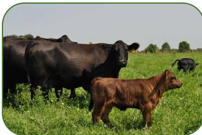
Fig. 1—Une vache avec ses veaux au pâturage.

La formule gagnante pour l'industrie du bœuf peut sembler assez simple : il faut des bovins fertiles, dont la croissance est efficace, qui produisent une carcasse de valeur en offrant la rentabilité. Le bouvier est de toute première importance dans ce processus. De nombreux bouviers ontariens conservent leurs propres génisses comme animaux de remplacement des vaches qui sont réformées du troupeau. Il existe une longue liste de caractéristiques qui décrivent une vache productive et l'importance relative de ces traits varie d'une ferme à l'autre. Certains sont considérés comme « convenables » mais dans les faits ce sont des traits nécessaires. Le fondement d'un bon troupeau c'est d'abord des vaches exemptes de problèmes, c'est même une nécessité! Malheureusement, de nombreux traits ne bénéficient pas d'écarts prévus dans la descendance (EPD) permettant de les évaluer, ce qui devrait changer bientôt heureusement, avec l'apport des évaluations de l'ADN. Il est nécessaire de mesurer les traits et de s'assurer qu'ils sont présents. Le rendement net des troupeaux commerciaux dépend de ces traits fonctionnels.