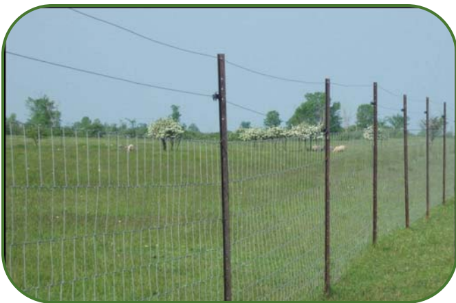
Fig 1. Clôture pour la lutte contre les prédateurs

Les fermes avec des broussailles et de la forêt sont sujettes à un plus grand nombre d'attaques que les espaces découverts non boisés. Les prédateurs passent plus souvent à l'offensive à l'aube et au crépuscule. Dans le cas de troupeaux moins nombreux il faut ramener les bêtes le soir dans une enceinte fermée. Les coûts des clôtures totalement à l'épreuve des prédateurs sont quelque peu prohibitifs surtout si un grand nombre de bovins doit être protégé, auxquels s'ajoutent des coûts de main-d'œuvre, ce qui peut rendre la chose hors de prix. Une étude effectuée en 2001 sur une ferme ovine de Amherst Island avait indiqué un prix de 2,37 $ le 0,31 m (le pied) pour une clôture de protection contre les prédateurs. Parmi les autres coûts imputables au confinement des bovins notons une charge à la hausse de la coccidiose, l'accroissement des mouches et une croissance réduite.