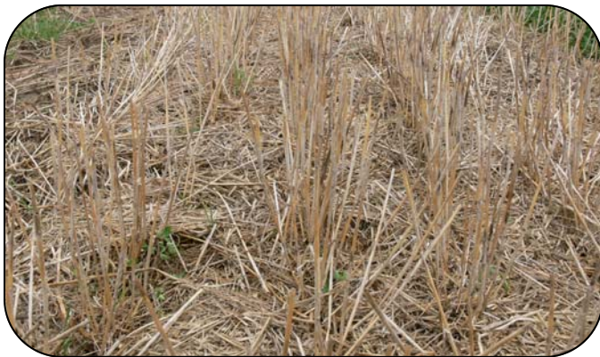
Figure 2. Trèfle rouge en avril à la suite d'un traitement au dicamba effectué à la fin octobre au taux de 125 mL/acre.