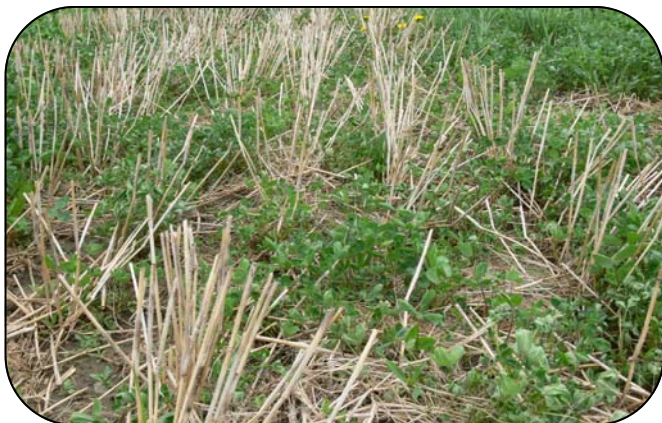
Figure 2. Trèfle rouge en avril à la suite d'un traitement au dicamba effectué à la fin octobre au taux de 125 mL/acre.